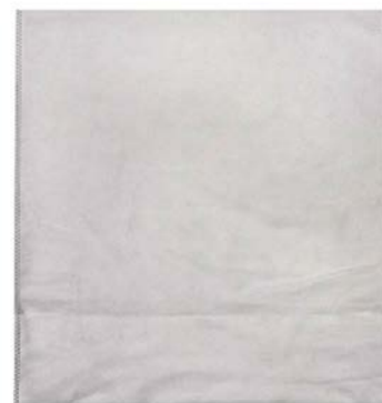
RTEKB + RTEKBB, Abb. weiß