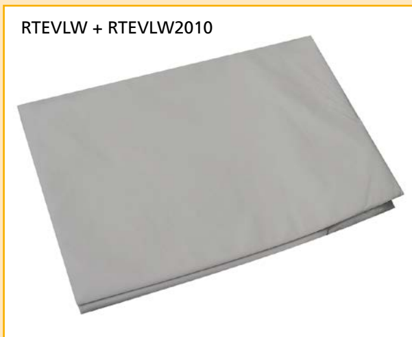
RTEVLW + RTEVLW2010